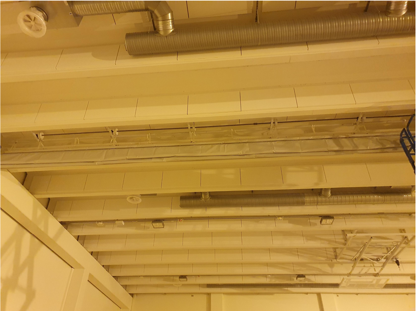
Liikuntasalin jakoverhojen asennus käynnissä