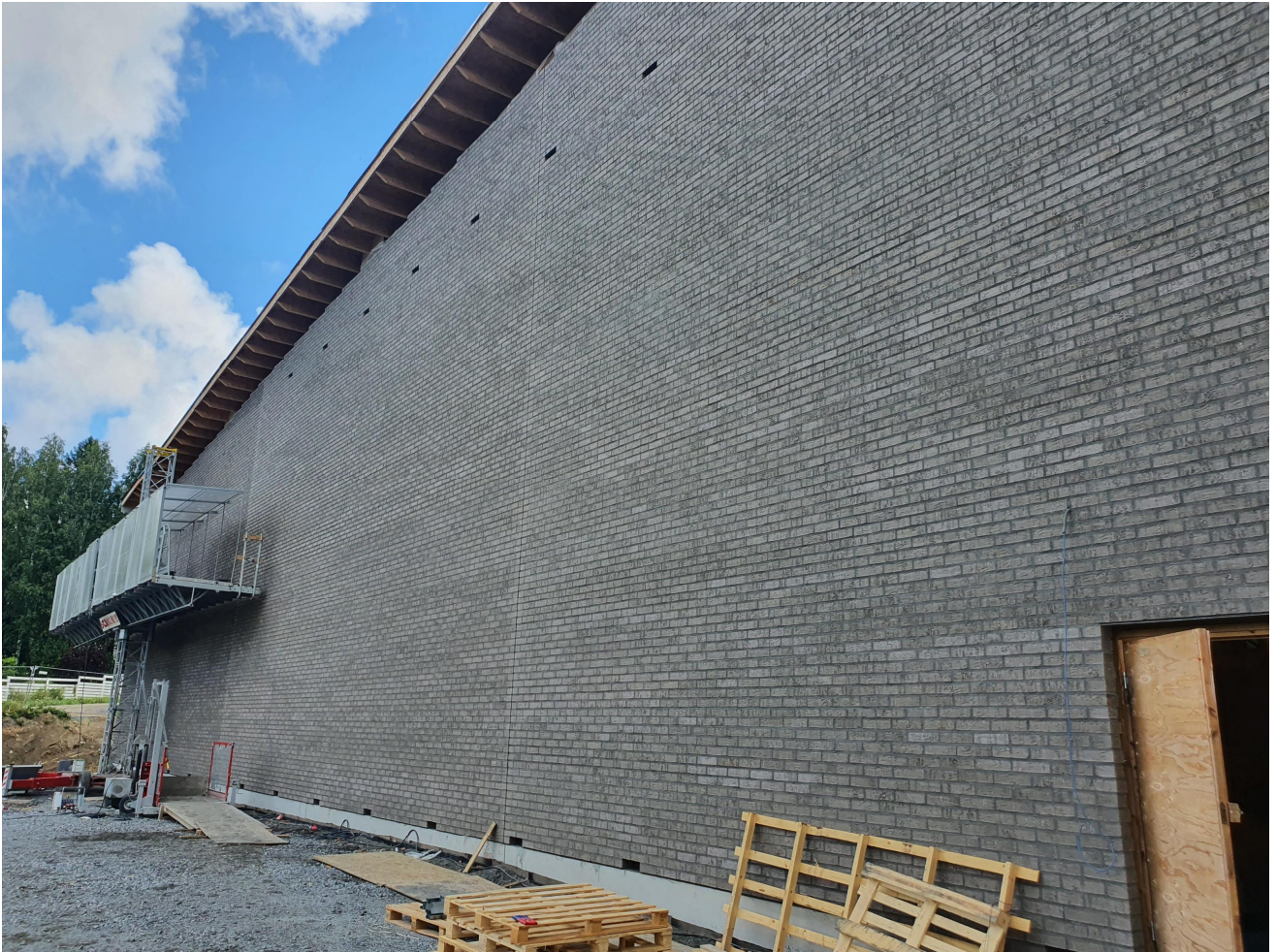
Liikuntasalin julkisivumuuraukset käynnissä